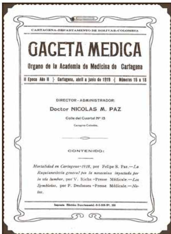
Facsimil de la portada de Gaceta Médica. Segunda época. Segundo año. Número 16 - 18 correspondientes a abril - Julio de 1919.

La Academia de Medicina de Cartagena aún está en funcionamiento, completando 125 años de existencia. No se tiene conocimiento si el periódico Gaceta Médica fue publicado en fechas diferentes a las señaladas.