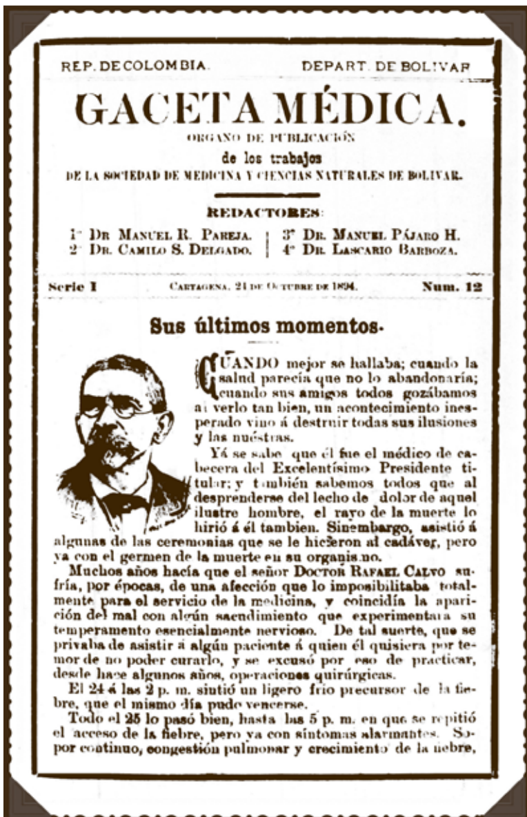
Facsimil de la portada del duodécimo número de Gaceta Médica. Octubre 1894.